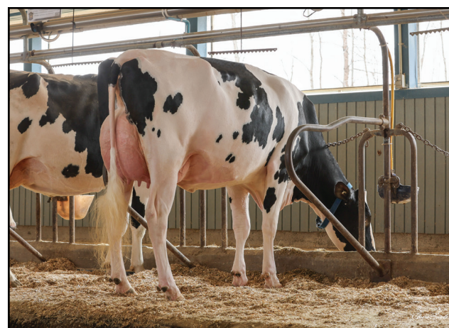
Fleury PARFECT Emery (VG-87-VG-87-MS 2YR) - Fleury Holstein, Saint-Christophe d'Arthabaska, QC