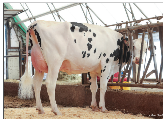
Creek Side ILLUSTRATOR Bronwyn (VG-85-VG-86-MS 2YR) - Creek Side Holsteins, Lombardy, ON