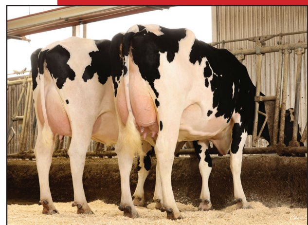
Alampco A2P2 Broad-P and Alampco A2P2 Imagix-P (VG-85-VG-85-MS 2YR), Ferme Alampco Holstein 2020, Sainte-Séraphine, QC

Front Cover: Desnette Jade DURAN (EX-93-EX-95-MS) 4YR; Maheufils CONWAY Amazing (VG-85-VG-85-MS) 2YR; Pair of Milking A2P2 daughters at Ferme Alampco Holstein 2020, QC; 3 milking daughters of CONWAY at Drewholme Holsteins, ON; Desnette Louise Crush (VG-87-VG-89-MS) 2YR